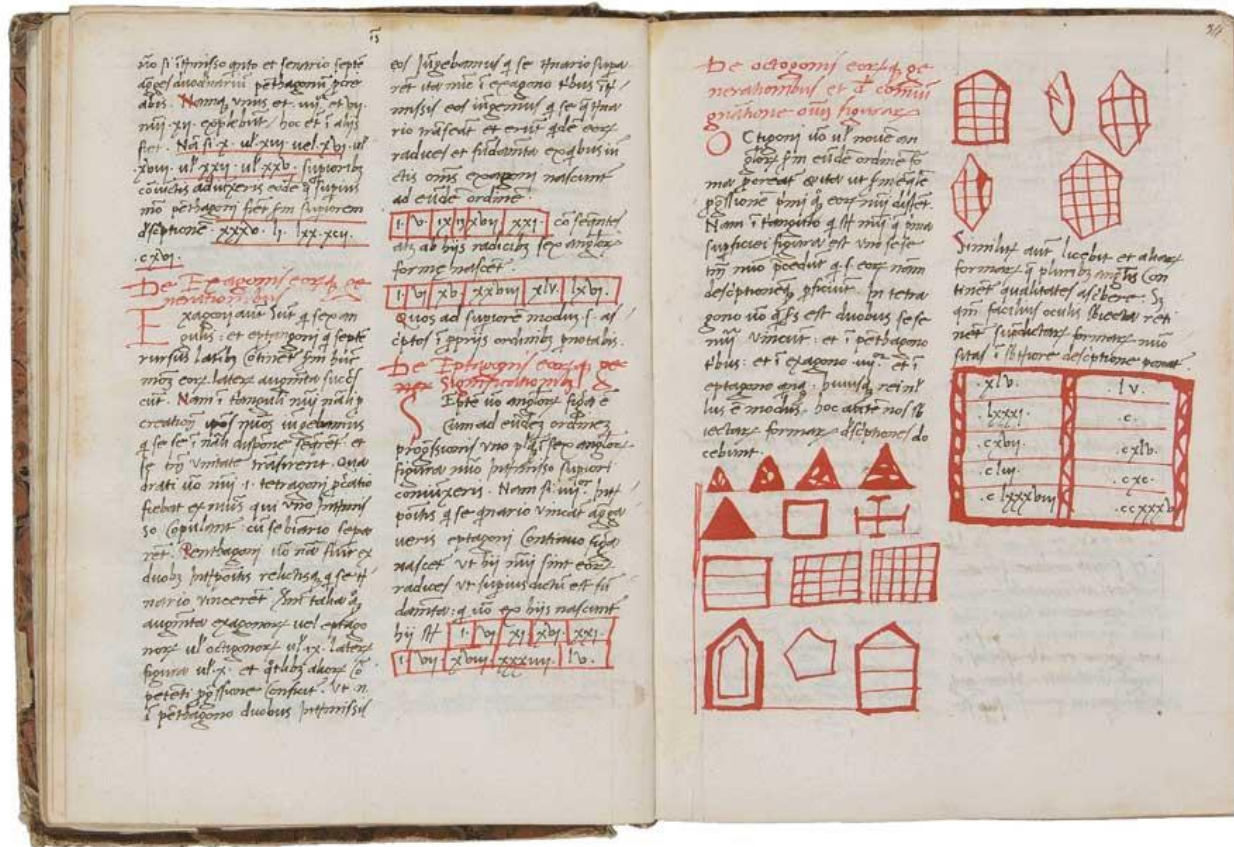
The Liber Abaci or Book of Calculation is by Leonardo Pisano Bigollo or Fibonacci, considered by many as one of the most talented western mathematicians of the Middle Ages. Featured in a rare 15th century manuscript estimated at between $120,000-180,000 (£75,000 – 110,000).